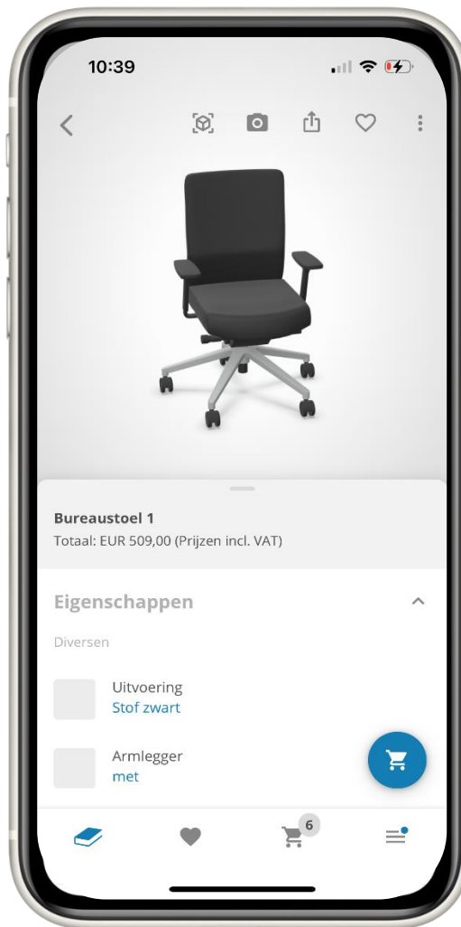
Afbeelding 2 – Wijzigen configuratie