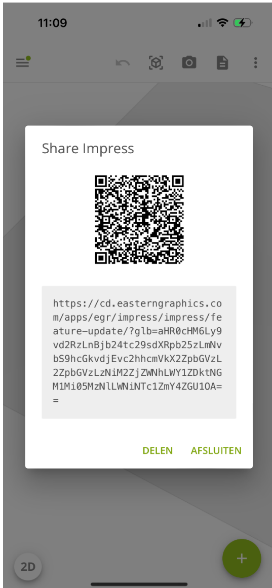
Afbeelding 1 – Dialoogvenster ‘Delen met impress’